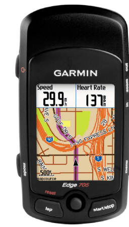
Garmin Edge 705 Software: 3.3.0.0 Korekce nadmořské výšky 📍: Zakázáno ▾ Souhrnná data: Originál