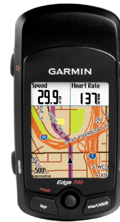
Garmin Edge 705 Software: 3.3.0.0 Korekce nadmořské výšky 📍: Zakázáno ▾ Souhrnná data: Originál