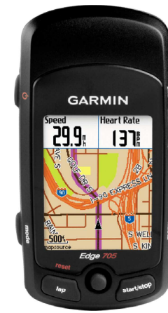
Garmin Edge 705 Software: 3.3.0.0 Korekce nadmořské výšky 🚫: Zakázáno ▾ Souhrnná data: Originál